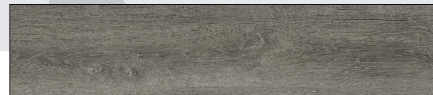
Vintage Eiche Grau REAL FEEL