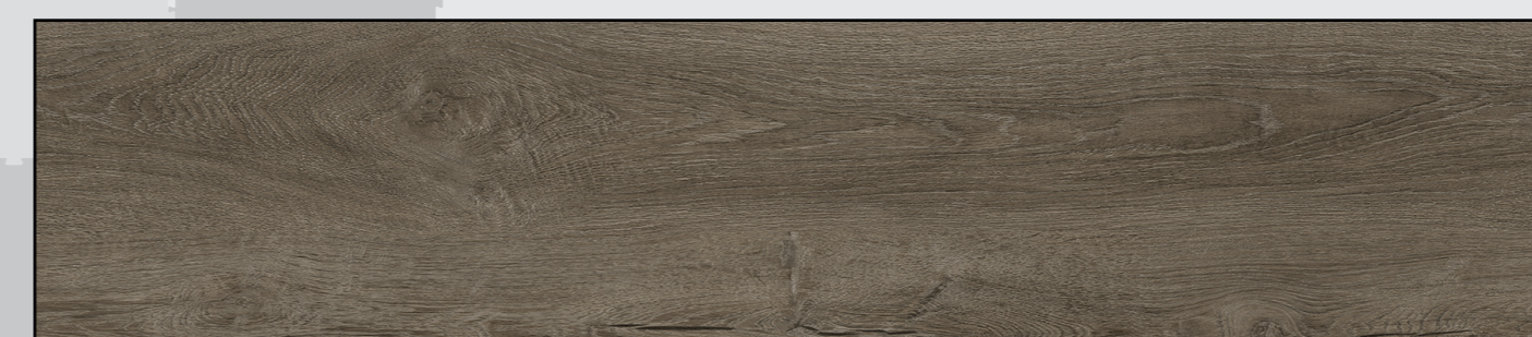
Vintage Eiche Hellgrau REAL FEEL