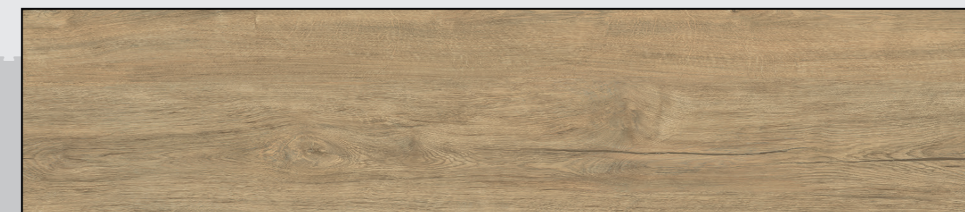
Antike Eiche Hell Natürlich REAL FEEL