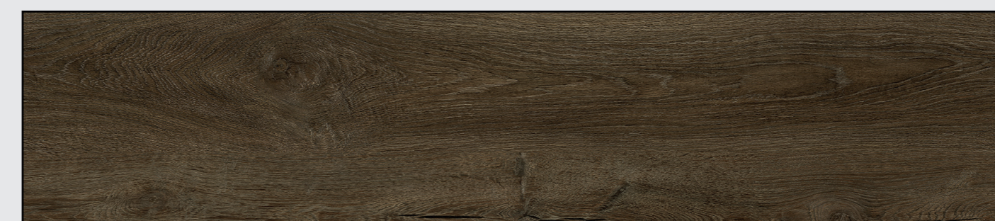
Vintage Eiche Dunkel Natürlich REAL FEEL